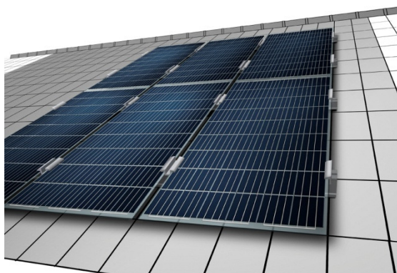
Abbildung I: Montage mittels Laminatklammern

Auf die Module wirken Flächenlasten aus Wind, Schnee und Eigengewicht. Diese werden über die Glasscheibe des Laminats und das Montagesystem abgetragen. Dazu müssen die Solarmodule mit einem geeigneten Montagesystem auf einer stabilen Unterkonstruktion befestigt werden. Ein Mindestabstand von 10 mm zwischen den Modulen wird empfohlen.